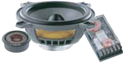
100 VRS 希望小売価格 ¥ 54,600 /1ペア(税込み)

●スピーカータイプ:130Mid/TNB Tweeter 2way separate slim-woofer ●再生周波数帯域:80Hz~28kHz ●定格入力:50W ●入カインピーダンス:4Ω ●出力音圧レベル:91.0dB(2.8V/1m) ●取付口径サイズ:93mm ●取付奥行サイズ:40mm ●クロスオーバー周波数:5.9kHz:12/12dB/Oct ※グリル付属