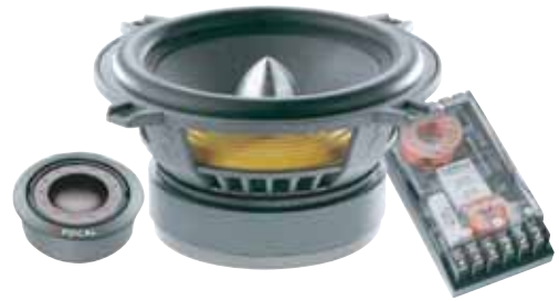
130 VR 希望小売価格 ¥ 58,800 /1ペア(税込み)

●スピーカータイプ:130Mid/TNB Tweeter 2way separate slim-woofer ●再生周波数帯域:80Hz~28kHz ●定格入力:50W ●入カインピーダンス:4Ω ●出力音圧レベル:91.0dB(2.8V/1m) ●取付口径サイズ:93mm ●取付奥行サイズ:40mm ●クロスオーバー周波数:5.9kHz:12/12dB/Oct ※グリル付属