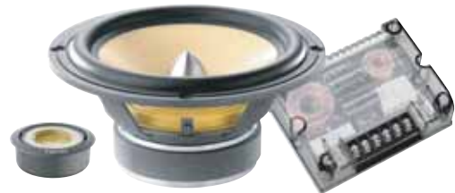
165 KR2 希望小売価格 ¥ 84,000 /1ペア(税込み)

●スピーカータイプ:100mm/TNK/2-way separate ●再生周波数帯域:120Hz~20kHz ●定格入力:50W ●入力インピーダンス:4Ω ●出力音圧レベル:90.0dB(2.8V/1m) ●取付口径サイズ:93mm ●取付奥行サイズ:39mm ●クロスオーバー周波数:3.5kHz:12dB/Oct