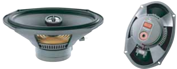
690 CVX 希望小売価格 ¥ 37,800 /1ペア(税込み)

●スピーカータイプ:100 Mid/Coaxial 2 Way ●再生周波数帯域:90Hz~20kHz ●定格入力:50W ●入カインピーダンス:4Ω ●出力音圧レベル:90.0dB(2.8V/1m) ●取付口径サイズ:94mm ●取付奥行サイズ:59mm ●クロスオーバー周波数:12dB/Oct ※グリル付属