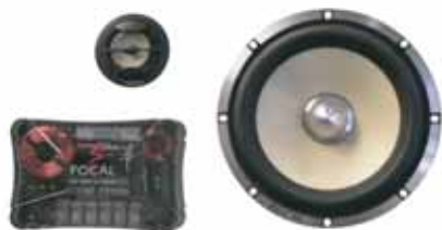
165 KRX2 販売予定売価格 ¥ 97,650 /1ペア(税込み)