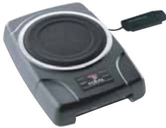
BUS 20 販売予定価格 ¥ 39,900 /1台(税込み)