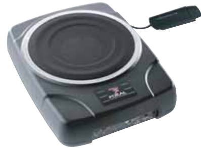
BUS 25 販売予定価格 ¥ 52,500 /1台(税込み)