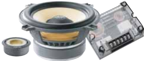
130 KR 希望小売価格 ¥ 66,150 /1ペア(税込み)

●スピーカータイプ:130mm/TNK/2-way separate ●再生周波数帯域:70Hz~20kHz ●定格入力:70W ●入力インピーダンス:4Ω ●出力音圧レベル:90.0dB(2.8V/1m) ●取付口径サイズ:115mm ●取付奥行サイズ:61mm ●クロスオーバー周波数:3.5kHz:12dB/Oct