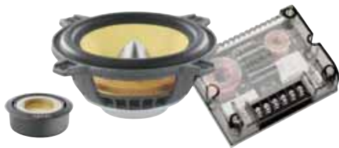
100 KRS 希望小売価格 ¥ 60,900 /1ペア(税込み)

●スピーカータイプ:165mm/TNK/2-way separate ●再生周波数帯域:60Hz~20kHz ●定格入力:80W ●入力インピーダンス:4Ω ●出力音圧レベル:91.0dB(2.8V/1m) ●取付口径サイズ:142mm ●取付奥行サイズ:71mm ●クロスオーバー周波数:3.8kHz:12dB/Oct