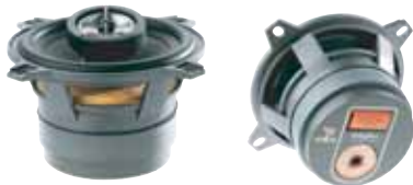
100 CVX 希望小売価格 ¥ 22,050 /1ペア(税込み)

●スピーカータイプ:130Mid/TNB Tweeter 2way separate ●再生周波数帯域:80Hz~28kHz ●定格入力:50W ●入カインピーダンス:4Ω ●出力音圧レベル:94.0dB(2.8V/1m) ●取付口径サイズ:161mm ●取付奥行サイズ:61mm ●クロスオーバー周波数:4.0kHz:12/12dB/Oct ※グリル付属