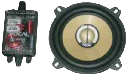
130 KRC 販売予定売価格 ¥ 66,150 /1ペア(税込み)

●スピーカータイプ:165mm/TNK/2-way separate/2Ω ●再生周波数帯域:700Hz~20kHz ●定格入力:80W ●入力インピーダンス:2Ω ●出力音圧レベル:93.0dB(2.8V/1m) ●取付口径サイズ:142mm ●取付奥行サイズ:73mm ●クロスオーバー周波数:4.0kHz:12/12/18dB/Oct ※インピーダンスにご注意ください。