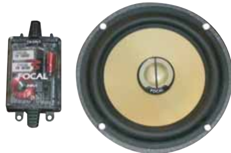
165 KRC 販売予定売価格 ¥ 71,400 /1ペア(税込み)