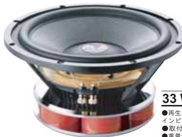
33 WX2 販売予定価格 ¥ 147,000 /1本(税込み)

●再生周波数帯域:27Hz~350Hz ●定格入力:400W ●入カインピーダンス:4Ω ●出力音圧レベル:92.0dB(2.8V/1m) ●取付口径サイズ:288mm ●取付奥行サイズ:150mm ●重量:12.45kg ●推奨BOX(バスレフ):35L~45L