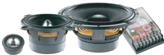
165 A3 販売予定価格 ¥ 46,200 /1ペア(税込み)