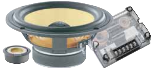
165 KR 希望小売価格 ¥ 71,400 /1ペア(税込み)

●スピーカータイプ:130mm/TNK/2-way separate ●再生周波数帯域:70Hz~20kHz ●定格入力:70W ●入力インピーダンス:4Ω ●出力音圧レベル:90.0dB(2.8V/1m) ●取付口径サイズ:115mm ●取付奥行サイズ:61mm ●クロスオーバー周波数:3.5kHz:12dB/Oct