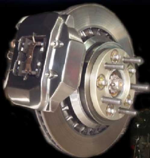
REAR 335mm 2piston Kit

LEXUS 純正ローターを使用して安心+高バランスを実現させ F357mm/R335mm と、国産セダンでは最大径のブレーキユニットです